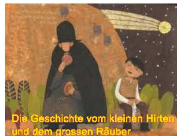
Die Geschichte vom kleinen Hirten und dem grossen Räuber

Mit einem Weihnachtsspiel des Kindergottesdienstes. Gespannt sein dürfen alle auf Lieder und die Geschichte vom kleinen Hirten und dem grossen Räuber.